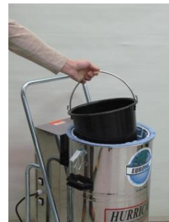
Karkean roskan erotinastia