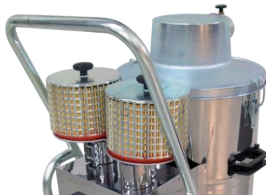
Hurricane 42 HEPA