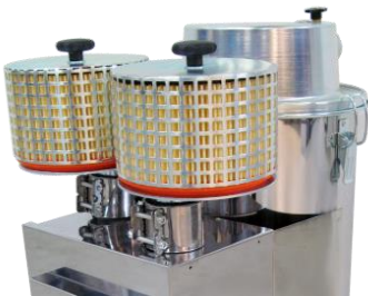
Hurricane 32 HEPA