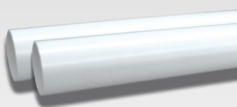
Runkoputki PVC 51mm

Jyrkkä kulmaliitin 90° imurasian asennukseen Koodi: 014102