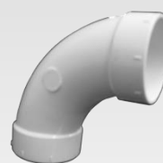
Loiva kulma 90°