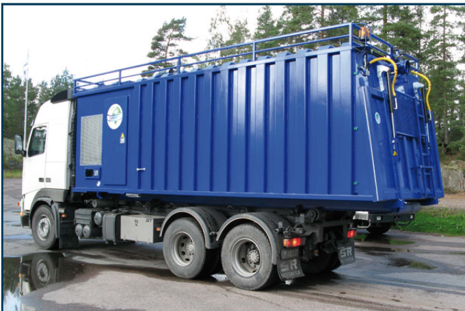
Dieselkäyttöinen suurtehoimuri tikkailla