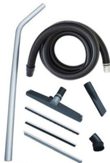
Kuvassa: Antistaattinen siivousvälinesarja 50 mm.