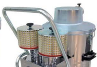
HURRICANE 42 HEPA