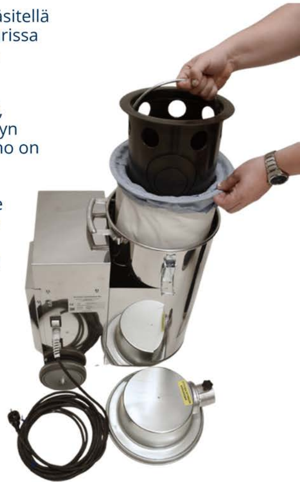
Helposti huollettava rakenne