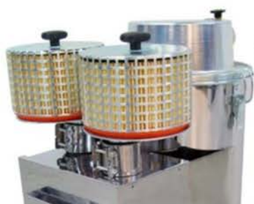
HURRICANE 32 HEPA

Hurricane-hienonpölynimureihin on saatavana kattava valikoima siivousvälinesarjoja ja lisävarusteita vaativaan ammattikäyttöön.