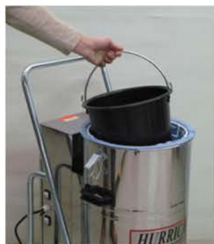
KARKEAN ROSKAN EROTINASTIA