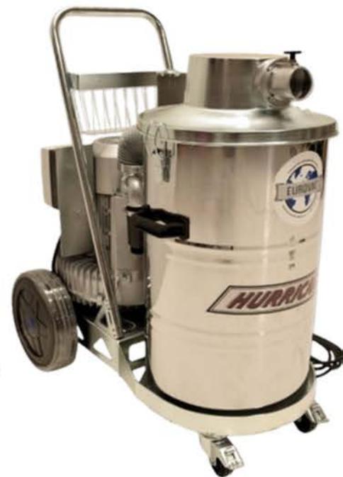
Lihtsasti hooldatav ja mitmekihiline filtrisüsteem

Puhastustarvikud on antistaatilised, voolikud Ø 38 mm ja Ø 50 mm (5 m ja 10 m).