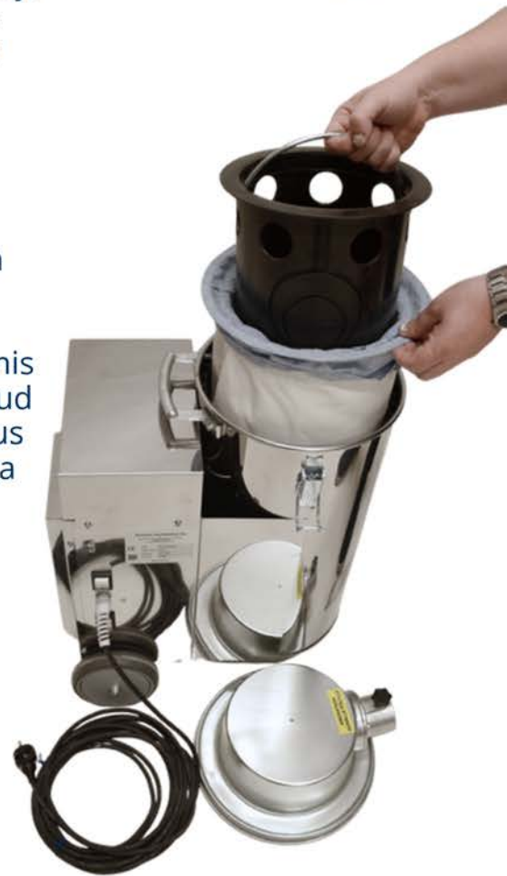
Lihtsasti hooldatav seade