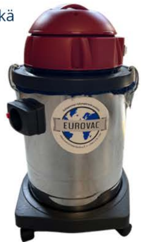
EUROVAC 303 S

Pitkä, 7,5 metrin virtajohto lisää työskentelyetäisyyttä ja tekee imurista helppokäyttöisen myös laajoissa tiloissa. Suodattimet ovat helposti puhdistettavissa ja pitkäikäisiä, mikä vähentää käyttökustannuksia ja jätteen määrää.