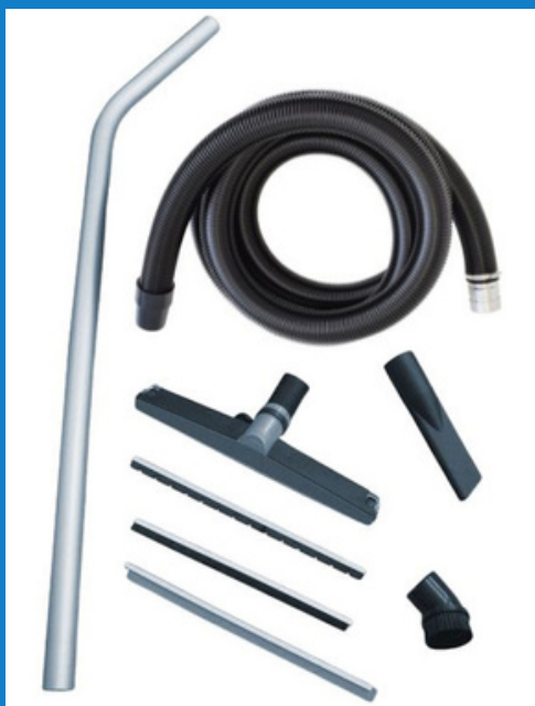
Antistaattinen siivousvälinesarja 50 mm

Roskasäiliö voidaan varustaa tarvittaessa myös kannakkeilla esimerkiksi hallinosturia varten, jolloin täysinäisen roskasäiliön liikuttelu on helppoa.