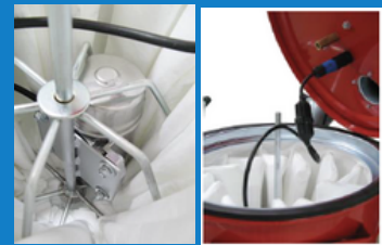
Automaattinen suodatinpuhdistus saatavilla lisävarusteena