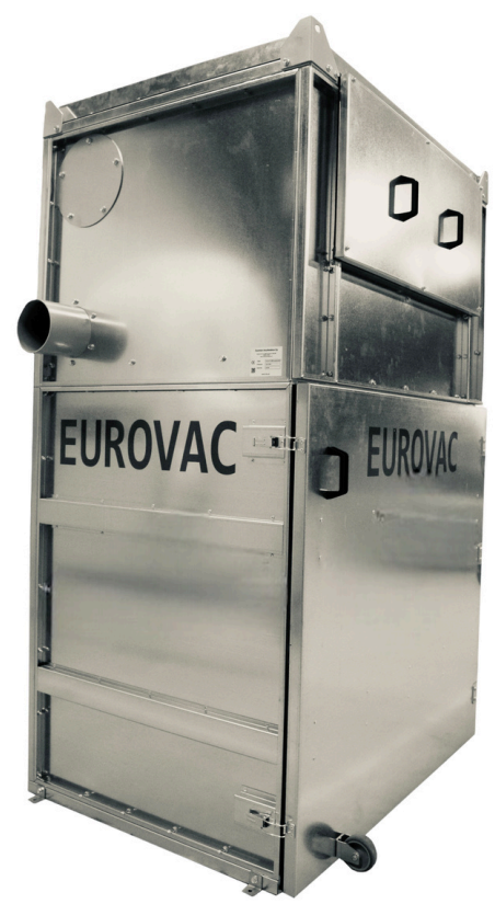
Näkymä laitteen sivulta