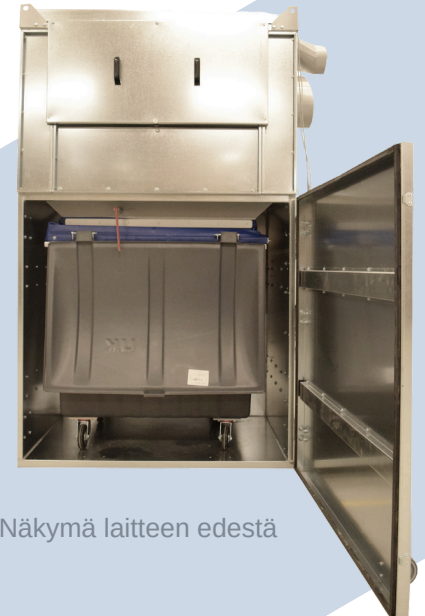
Näkymä laitteen edestä