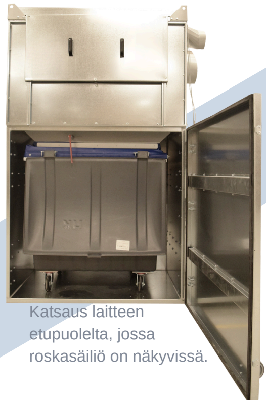
Katsaus laitteen etupuolelta, jossa roskasäiliö on näkyvissä.