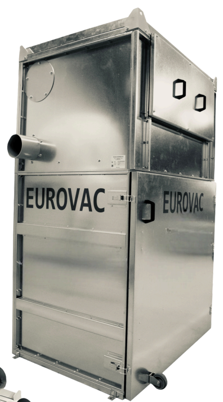
Näkymä laitteen sivuilta