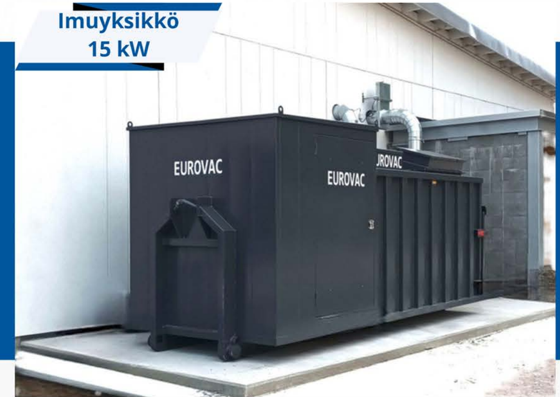
Turengin koulu-ja monitoimikeskus