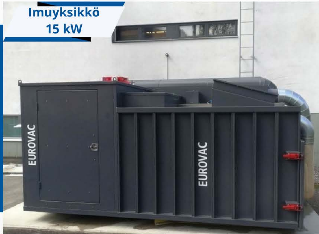
Rauman OKL (Suomen Yliopistokiinteistöt)

TÄSSÄ MUUTAMIA ESIMERKKEJÄ EUROVAC-PURUNPOISTOJÄRJESTELMISTÄ, JOITA OLEMME TOIMITTANEET ERI PUOLILLE SUOMEA.